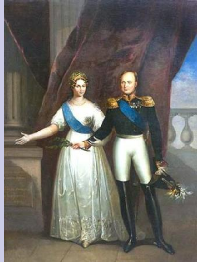
Неизвестный художник – Мир Европы 1815 г.

Екатерина II пригласила в Петербург из Бадена юную принцессу Луизу - умницу, красавицу, очаровавшую в октябре 1792 г. не только наследника, но и, казалось, всех мужчин столицы. 23 сентября 1793 г. состоялось бракосочетание пятнадцатилетней Луизы, нареченной в России Елизаветой, с шестнадцатилетним Александром. Елизавета безумно была влюблена в своего молодого супруга. С годами эта любовь ослабела. И только к концу жизни снова началось сближение между супругами.