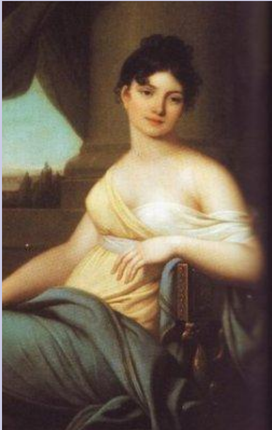
Дж. Грасси- М. А. Нарышкина

Одарённая от природы красотой Мария в 15 лет была уже фрейлиной. В 1795 году, в возрасте 16 лет, Мария Четвертинская вышла замуж за 37-летнего князя Дмитрия Нарышкина. Мария вызвала глубокую сердечную привязанность императора Александра Павловича. Ф. Ф. Вигель писал: "О взаимной любви её с императором Александром я не позволил бы себе говорить, если бы для кого-нибудь она оставалась тайной".