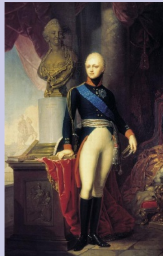
В. Л. Боровиковский – Александр I

13 декабря 1805 Кавалерственная Дума ордена Св. Георгия обратилась к Александр с просьбой возложить на себя знаки ордена 1-й степени, однако Александр отказался, заявив, что «не командовал войсками» и принял лишь 4-ю степень. Учитывая, что сделано это было после страшного поражения русской армии при Аустерлице, причём командовал армией де-факто именно Александр, можно заметить, что скромность императора была всё же не феноменальна. Тем не менее, в бою под Аустерлицем он сам пытался остановить бегущих солдат со словами: «Стой! Я с вами!!! Ваш царь с вами!!!»