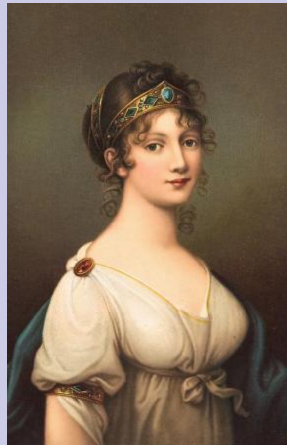
Дж. Грасси- Королева Луиза

Александр обожал женщин, но, когда этого требовали какие-то высшие соображения, он умел не поддаваться даже самым обольстительным любовным чарам. Страсть, которую питала к нему королева Пруссии Луиза, так и осталась без ответа. Зная себя и боясь уступить ей и оказать Пруссии поддержку, царь хотел сохранить независимость своей политики. Александр Павлович, когда гостил в Мемеле, у королевской четы, боясь прихода ночью этой обаятельной женщины, запирался от нее на замок... Позднее, после разгрома Пруссии, Луиза приехала с мужем в Петербург, надеясь все-таки завладеть сердцем Александра. Но когда на балу она увидела Марию Антоновну Нарышкину, в гладком белом платье, без единой драгоценности, и то, каким взглядом смотрел на свою избранницу Александр, Луиза поняла, что ей никогда не достичь своей цели.