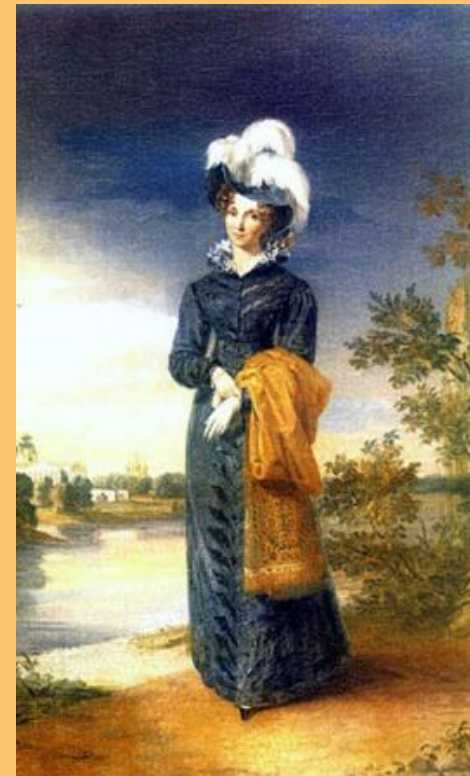
Д. Доу - Портрет императрицы Елизаветы Алексеевны

Елизавета Алексеевна много занималась благотворительностью, при этом не афишировала своих деяний. Так, из положенной ей ежегодно суммы в миллион рублей, императрица брала лишь двести тысяч, из которых на личные расходы оставляла только пятнадцать тысяч, а остальные деньги отдавала на благотворительные дела.