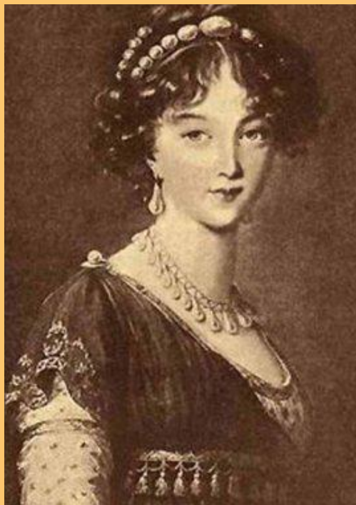
Великая княгиня Елизавета Алексеевна

Но вскоре великий князь охладил к молодой жене. Первым попытку завоевать Елизавету предпринял фаворит Екатерины II Платон Зубов. Дошло до того, что императрице пришлось устроить ему скандал и прямо запретить преследовать невестку! Вынужденно Зубов отступился: спорить с Екатериной никто не решался.