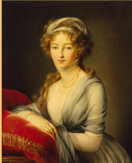
Э. Виге-Лебрен – Елизавета Алексеевна

В то время в Санкт-Петербурге находились в качестве знатных заложников после раздела Польши молодые князья Адам и Константин Чарторыйские. Адам стал одним из близких друзей Александра и, часто бывая в его доме, не устоял перед чарами прелестной Елизаветы. Она всячески избегала его, как и графа Зубова, но тем не менее среди «доброхотов» царского двора поползли разные слухи. Дошло даже до того, что когда в 1798 году у Елизаветы Алексеевны родилась первая дочь, Павлу Петровичу, ставшему тогда уже императором, нашептали, что истинным отцом ребенка является князь Адам Чарторыйский.