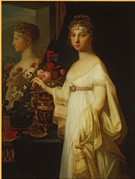
Ж.-Л. Монье- Портрет императрицы Елизаветы Алексеевны

Известный историк конца XIX - начала XX века, великий князь Николай Михайлович, работая над монографией о времени Александра I, наткнулся на секретные документы, открывшие ему тайну трагического романа императрицы Елизаветы Алексеевны. Узнав об этом, Николай II был в шоке, и, как его ни успокаивал великий князь, заверяя, что о личной жизни императрицы он написал «тайную главу», царствующий император повелел все уничтожить, хотя «тайная глава» существовала всего в 10 экземплярах - только для членов дома Романовых. И то не для всех. Приказание Николая II выполнили. Но то ли в спешке, то ли по умыслу, то ли специально по просьбе князя-историка «забыли» про типографский набор. Так печальная повесть о любви Елизаветы Алексеевны и кавалергарда Охотникова дошла до наших дней. Они оба заплатили жизнями за радость, пусть и недолгую, светлой и чистой любви.