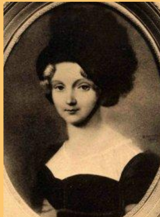
Миниатюра Беннера - императрица Елизавета Алексеевна

Вспыльчивый Павел пришел в бешенство и чуть не загнал Адама в Сибирь, но любимец императора граф Ростопчин сумел убедить самодержца, что Елизавета «столь же невинна, сколь и добродетельна». Но все же князь Адам был отправлен послом к королю Сардинии, изгнанному из своих владений и скитавшемуся по всей Италии. А Адам действительно любил Елизавету, но никогда не пользовался взаимностью - она была к нему холодна. В 1801 году Чарторыйжский вернулся в Санкт-Петербург, уже не опасаясь гнева Павла I, и целых пять лет безуспешно пытался возбудить в Елизавете Алексеевне ответное чувство. Но тщетно. Тогда он покинул столицу. Вновь они встретились в Польше, в 1814 году, но мимоходом, и только в 1817 году произошла их последняя встреча и окончательное объяснение. После него в том же году 47-летний князь Адам женился на Анне Сапежанке и больше никогда не стремился увидеться с императрицей Елизаветой Алексеевной.