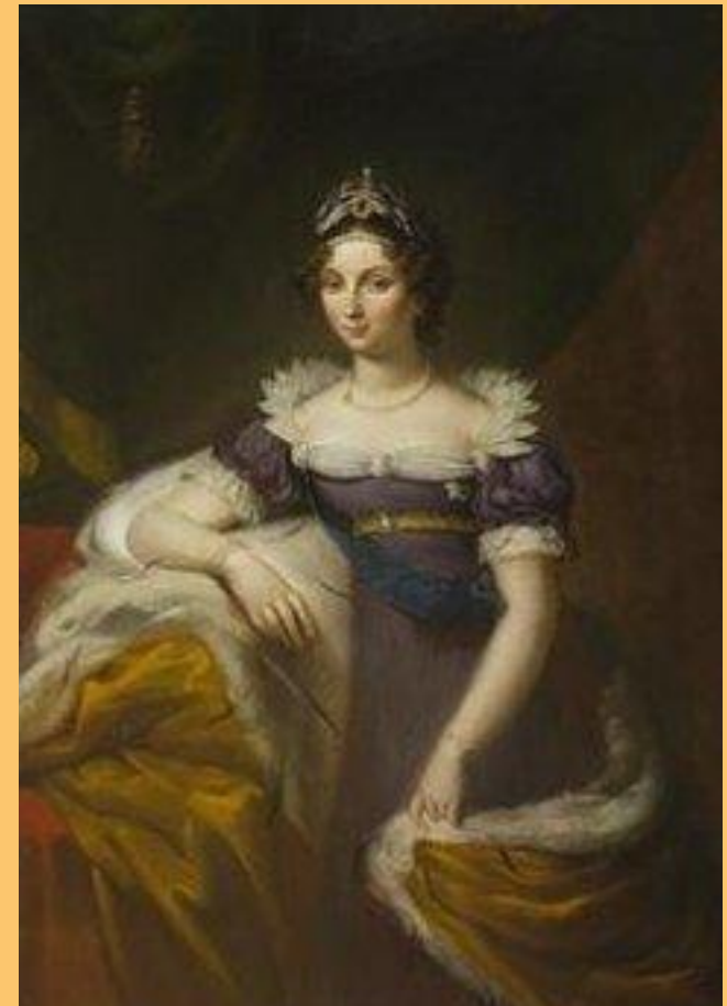
Неизвестный художник -Императрица Елизавета Алексеевна.

Елизавете Алексеевне не суждено было насладиться семейным счастьем: она имела двух дочерей - Марию (1799-1800) и Елизавету (1806-1808), но скоро их потеряла. Измены мужа, имевшего фактически вторую семью с Марией Нарышкиной, родившей императору троих детей (всего Александру приписывается 11 внебрачных детей), доказывали холодность, которую он питал к супруге. Фактически 20 лет Елизавета была «соломенной вдовой».