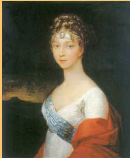
Неизвестный русский художник

В 1817 году императрица познакомилась с историком Николаем Михайловичем Карамзиным, и вскоре между ними установились дружеские отношения. Со временем их отношения стали настолько доверительными, что императрица читала ему вслух свои дневники, которые она вела со времени приезда в Россию. Об этой подробности сообщил сам Карамзин перед смертью. Императрица хотела завещать свой дневник именно ему, но историк умер через две недели после кончины Елизаветы Алексеевны (простудившись на Сенатской площади), и потому её желание не было выполнено, дневник был сожжён Николаем I.