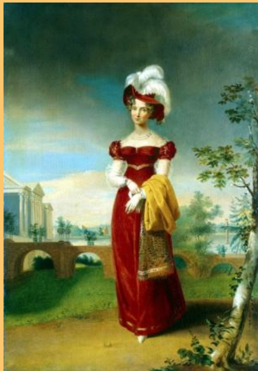
Д. Доу - Портрет императрицы Елизаветы Алексеевны в парке Царского Села

Елизавета Алексеевна много занималась благотворительностью, при этом не афишировала своих деяний. Так, из положенной ей ежегодно суммы в миллион рублей, императрица брала лишь двести тысяч, из которых на личные расходы оставляла только пятнадцать тысяч, а остальные деньги отдавала на благотворительные дела.