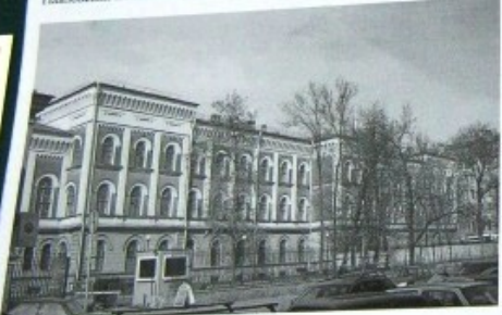
Павловский женский сиротский институт - Гимназия №209

Восстания ул., 4 Архитекторы: Железевич Р. А. Год постройки: 1845-1851 Стиль: Неороманское Павловский женский сиротский институт - Гимназия №209 ин. арх. (резнов.) 1845-1851 гг. арх. Р. А. Железевич интерьер Павловского женского института 17-1880 гг. - арх. Барн Густав Мартинсон (Карлович) Восстания, 8 проект в 1845-1851 гг. арх. Р. А. Железевич специально для Павловского женского сиротского института, основанного в 1836 г. В XVIII веке территорию от Фонтанки до Лыцкого канала занимал Итальянский дворик (наб. Фонтанки, 36). Территория сада позже стала застраиваться.