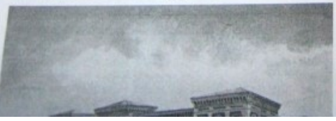
Дом Российско-Американской компании - Дом Общества для ипотечных дел - Здание ломбарда

Восстания ул., 4 Архитекторы: Железевич Р. А. Год постройки: 1845-1851 Стиль: Неороманское Павловский женский сиротский институт - Гимназия №209 ин. арх. (резнов.) 1845-1851 гг. арх. Р. А. Железевич интерьер Павловского женского института 17-1880 гг. - арх. Барн Густав Мартинсон (Карлович) Восстания, 8 проект в 1845-1851 гг. арх. Р. А. Железевич специально для Павловского женского сиротского института, основанного в 1836 г. В XVIII веке территорию от Фонтанки до Лыцкого канала занимал Итальянский дворик (наб. Фонтанки, 36). Территория сада позже стала застраиваться.