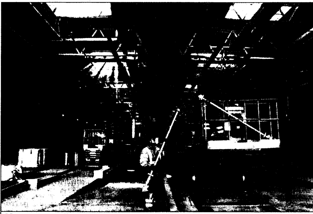
Металлострой: Делю ТЧ-10 готовится к приему первого состава Velaro RUS из Германии. Для обслуживания высокоскоростного подвижного состава требуется полная реконструкция производственного и вспомогательного корпусов депо, строительство модульных электростанций, реконструкция контактной сети и устройств электрооборудования, системы автоматической диагностики подвижного состава. Необходимо также переустройство железнодорожных путей, оборудование систем связи и другие мероприятия. Все эти работы находятся на стадии завершения. По утверждению железнодорожников, 1 декабря 2008 года депо XXI века распахнет свои ворота первому скоростному поезду для Российских железных дорог.

Известны примеры, когда в других странах реформа сопровождалась всплеском нарушений безопасности движения поездов, коллапсом перевозок пассажиров, грузов, полной перереорганизацией грузопотоков на другие виды транспорта. Можно ска-