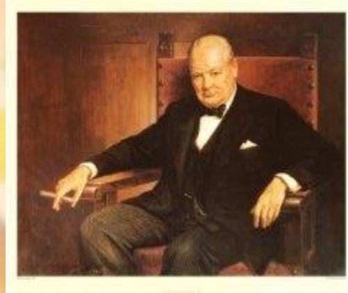
Уинстон Черчилль - британский государственный и политический деятель, Нобелевский лауреат.