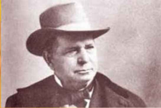
Оливер Фишер Винчестер - американский изобретатель и производитель стрелкового оружия.