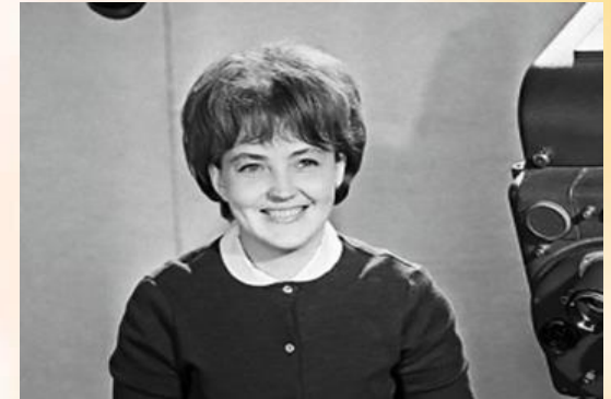
Светлана Жильцова - советская и российская телеведущая, диктор телевидения, Заслуженная артистка РСФСР.