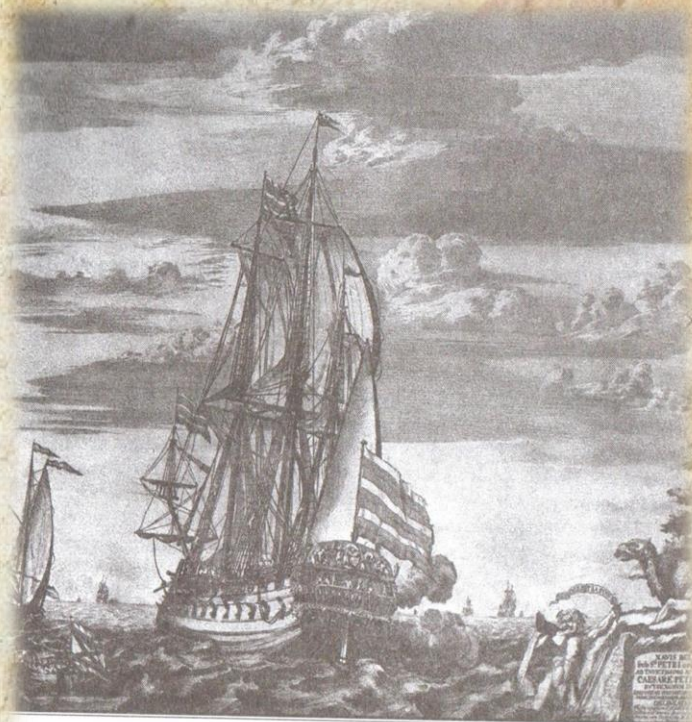
«Гото Предестинация» («Божие Предвидение») Первый корабль, построенный лично Петром Великим со товарищи в Воронеже после возвращения из заграничного путешествия

На 20 октября (30 октября) было назначено заседание Боярской Думы, к которому Пётр I подготовил записку с названием: «статьи удобные, которые принадлежат к взятой крепости или фартеции турок Азова». Это стало первым законом о флоте и официальной датой его основания. С этого времени началась подготовка флотских кадров и стали закладываться основы судостроения. Азовский флот был создан Петром I для борьбы с Турцией за выход в Черное море. В короткий срок, с ноября 1665 по май 1699 года в Воронеже, Козлове и других городах, расположенных по берегам рек, впадающих в Азовское море, были построены 36-пушечные корабли «Апостол Пётр» и «Апостол Павел», четыре брандера, 23 галеры, 1300 стругов, морских лодок и плотов. Они и составили Азовскую флотилию.