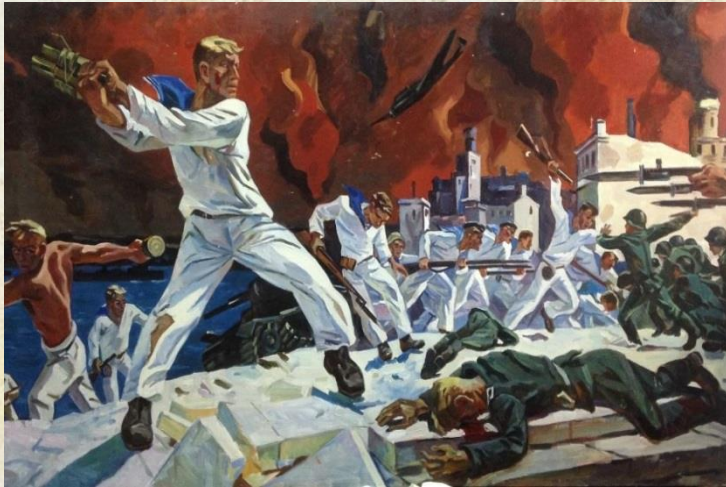
А. Дейнека "Оборона Севастополя" (1942)