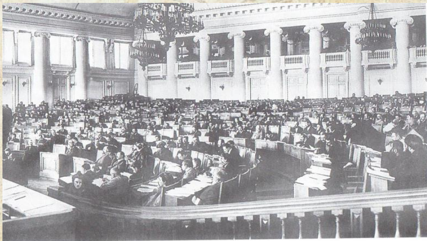
Первая Государственная Дума .

Ольденбург, Сергей Сергеевич. Царствование Николая II / С. С. Ольденбург. - Москва : АСТ : Астрель, 2003. - С.368-375. : ил. - (Историческая библиотека). - Библиогр. в подстроч. прим.