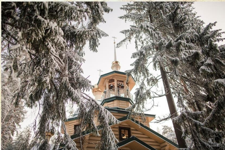
Храм Всех Святых, в земле Санкт-Петербургской просиявших, на Левашовском мемориальном кладбище