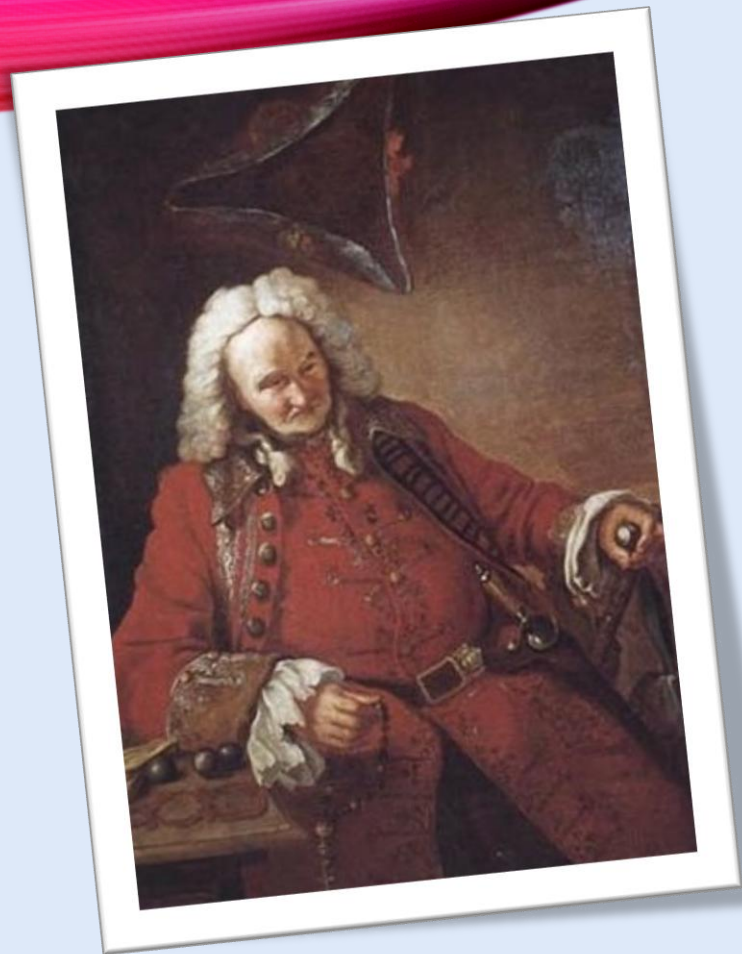
Князь Никита Фёдорович Волконский — шут императрицы Анны Иоанновны.

Среди шутов при дворе были и родовитые дворяне. Один из них- князь Никита Федорович Волконский. После смерти жены императрица пожелала иметь его при дворе в качестве шута. Он был приговорен к шутовству из личной мести императрицы, ненавидевшей его жену.