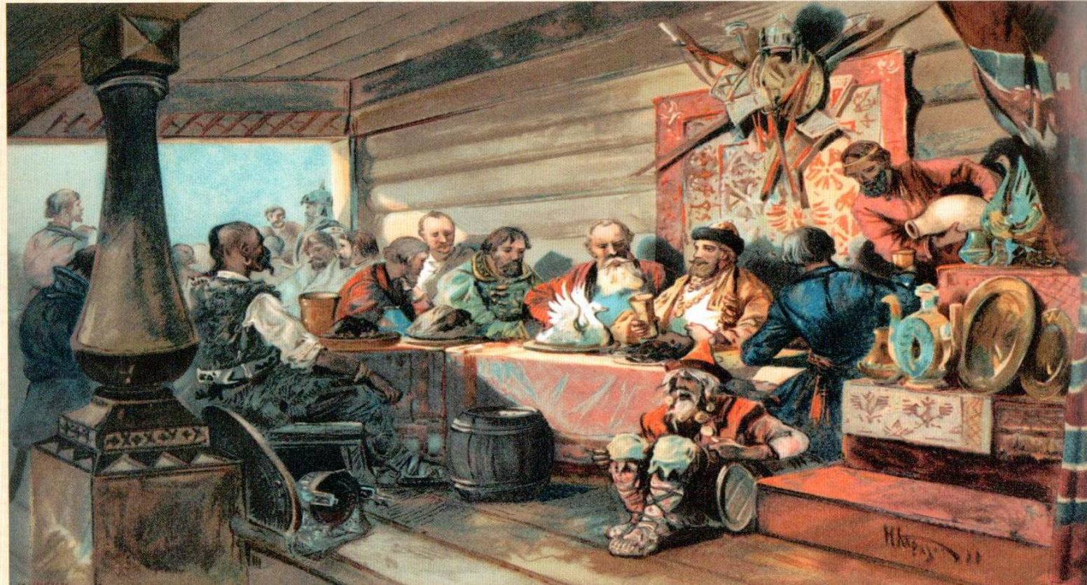
Н. Каразин. Шир у князя Владимира

В обязанности шута входило развлекать забавными выходками господ и гостей, при том, что со средневековья прослеживается определённая связь шутловства с традицией юродства. Основным качеством шута было не столько умение балагурить и шутить, сколько обескураживать и высмеивать злое и лживое, что особенно ценилось в русском народе. Он одинаково должен был уметь и шутить с толпой, и отшучиваться от царя.