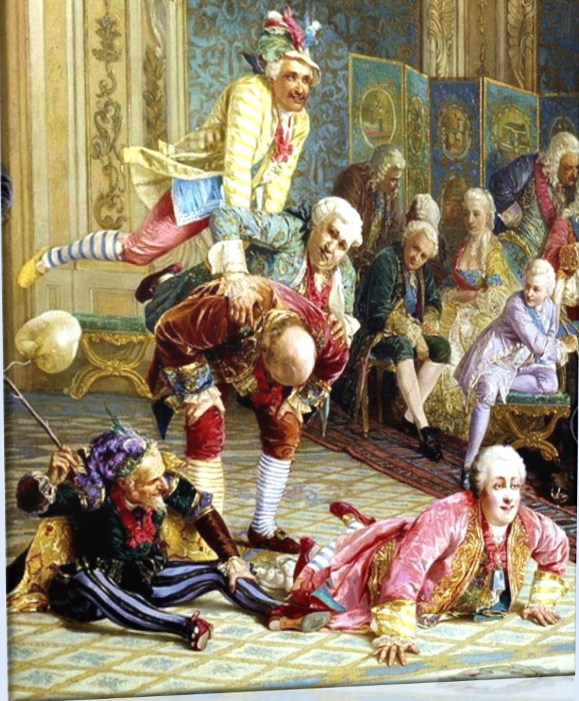
Шуты при дворе императрицы Анны Иоанновны). 1872 фрагмент

Любимым развлечением императрицы были драки шутов. Шутам приходилось повиноваться беспрекословно. Балакирев отказался один раз вступить в драку. За это императрица приказала выпороть его нещадно.