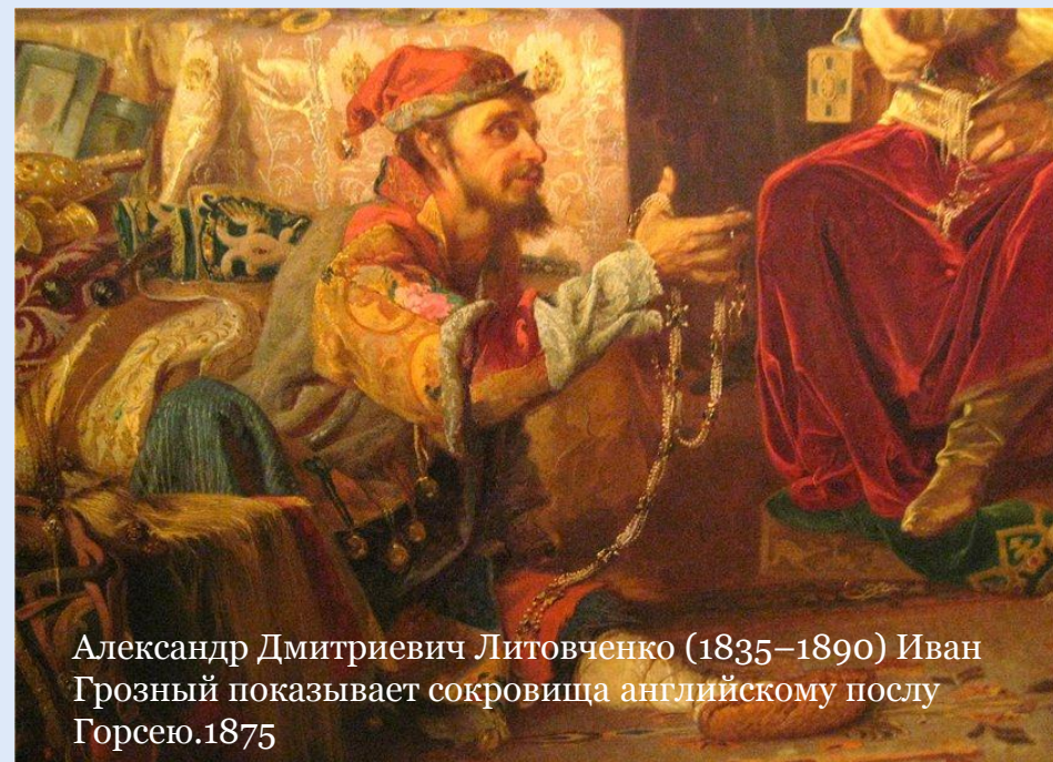
Александр Дмитриевич Литовченко (1835–1890) Иван Грозный показывает сокровища английскому послу Горсею. 1875

Согласно легенде, Грозный осерчал на своего шута за то, что тот усомнился в родстве царя с римскими императорами, и окунул лицом в кипящие щи. А когда шут вырвался и попытался убежать, самодержец догнал его и зарезал ножом.