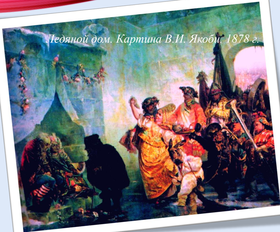
Ледяной дом. Картина В.И. Якоби. 1878 г.

Пожалуй, самый известный эпизод, связанный с Голицыным, - шутовская свадьба в Ледяном доме. В последний год своего царствования Анна Иоанновна приказала поженить Голицына и свою калмычку Евдокию Буженинову. (У шутихи не было фамилии. Буженинова - это прозвище в честь любимого блюда императрицы). Свадьба справлялась в феврале 1740 г. По приказу Анны Иоанновны в столицу были свезены представители всех народностей России по два человека от «всех племён и народов». Жених и невеста ехали в церковь в специальной клетке, поставленной на слона. Следом за молодыми приглашенные ехали на санях, запряженные быками, собаками, оленями, козами и свиньями.