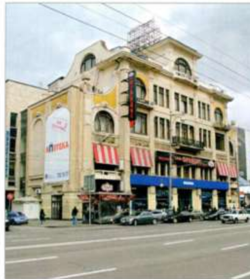
Издательство «Русское слово», Москва, улица Тверская.

с многочисленными приложениями, газету «Русское слово».