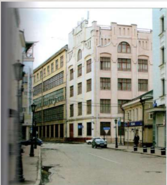
Типография товарищества Ивана Сытина. Москва, улица Пятницкая.

Продукция товарищества Сытина была отмечена многочисленными российскими и зарубежными наградами, в т. ч. золотыми и серебряными медалями Всемирных выставок 1889 и 1900 гг. в Париже, правом изображения государственного герба в 1896 г., и др.