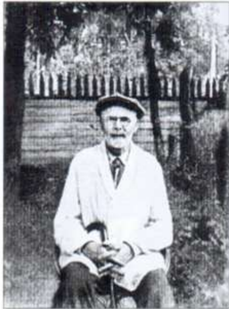
Последнее фото Сытина. 1930-е годы.