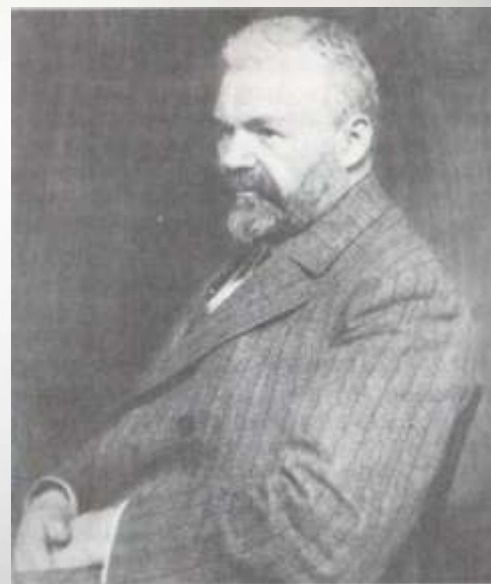
И. Д. Сытин Фотография начала XX века