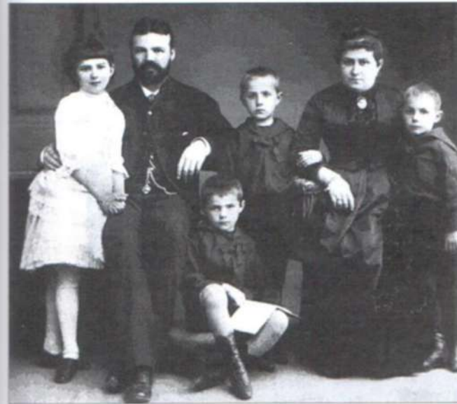
Иван Сытин с супругой и детьми. Фото конца XIX в.

Заняв примерно столько же у Петра Шарапова, он открыл на Воронухиной горе (между улицами Арбат и Смоленской) литографическую мастерскую.