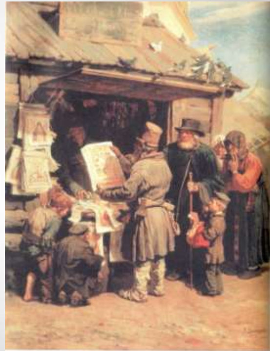
В. М. Васнецов. Кашкая Анточка. 1876. Масло

Скоро трудолюбивый, общительный и предприимчивый молодой человек стал ближайшим помощником пожилого московского купца Шарапова и выполнял наиболее ответственные его поручения.