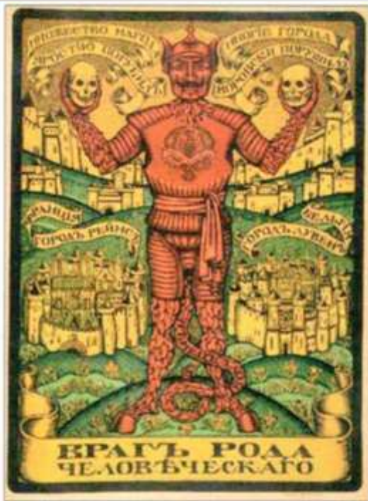
Враг рода человеческого. Лубочный плакат времен Первой мировой войны (1914-1918 гг.).

Во время Русско-турецкой войны 1877-1878 гг. Сытин тиражировал изображения сражений и карты боевых действий, снабдив их подписью: «Для читателей газет. Пособие», что дало немалую прибыль.