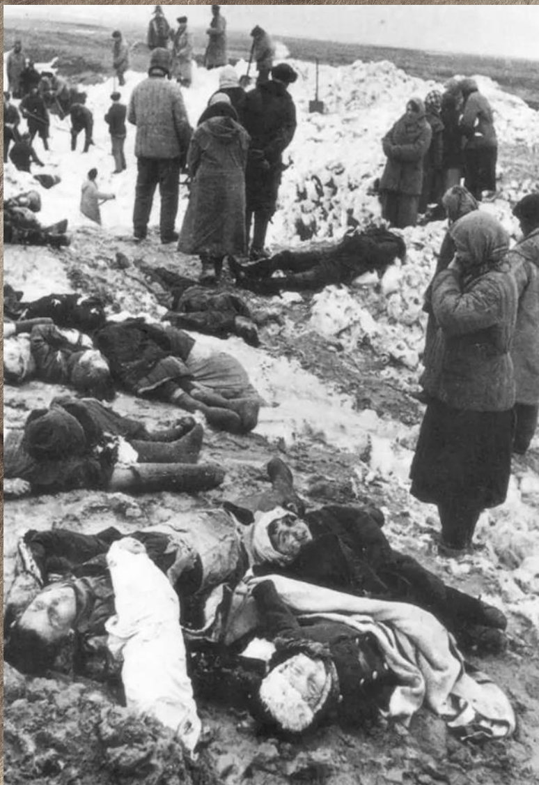
Багеровский противотанковый ров близ Керчи январь 1942г