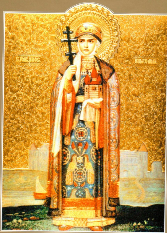
Икона Св. Ольги Из книги «Женщины-легенды»

Первая женщина-правительница на Руси. Став женой киевского князя, Ольга неожиданно для всех поднялась вровень с мужем. После гибели князя Игоря она жестоко отомстила убийцам супруга. В житии Святой Ольги сказано: «Управляла княгиня Ольга подвластными ей областями Русской земли не как женщина, но как сильный и разумный муж, твердо держа в своих руках власть».