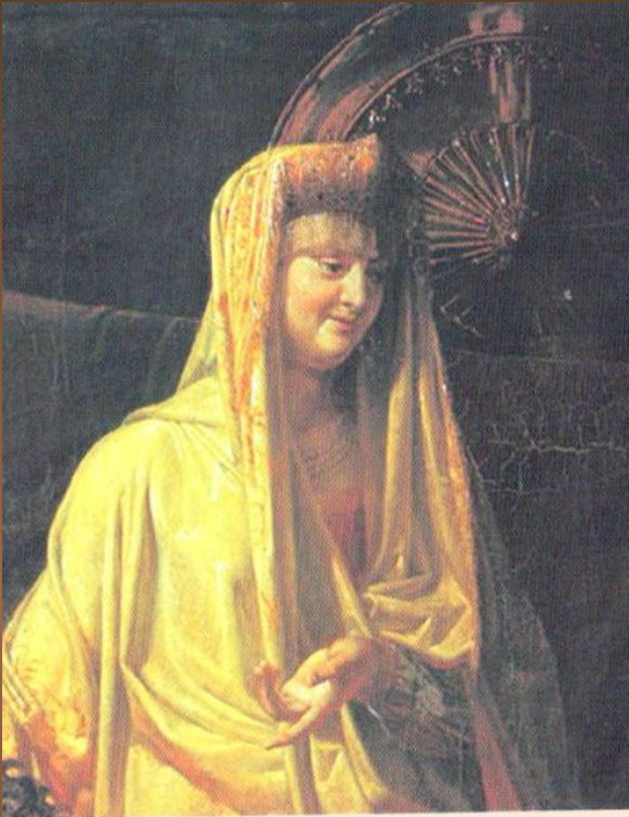
Борецкая Марфа (2-я пол. XV в.)

Господин Великий Новгород - мощный и богатый город. Женщины Новгорода имели большие права и влияли на культурную, хозяйственную и семейную жизнь города. Имели право собственности. Многие из них стояли во главе дома, были хозяйками семейного имущества и организаторами домашнего уклада.