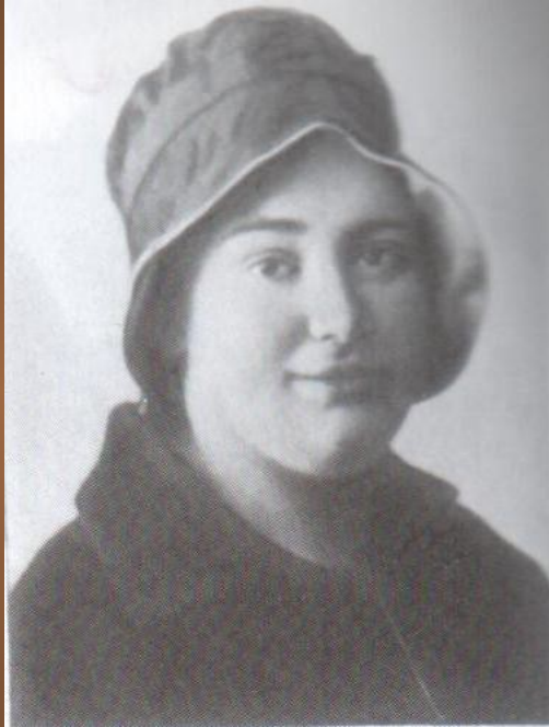
Елизавета Юрьевна Кузьмина- Караваева фото из книги «Великие женщины России»

Елизавета Юрьевна Кузьмина–Караваева (в девичестве Пилипенко) окончила высшие Бестужевские курсы (философское отделение историко-филологического факультета). Елизавета Юрьевна, талантливая поэтесса, переписывалась с А. Блоком. Посещала собрания «на башне» Вяч. Иванова, заседания «Цеха поэтов», религиозно-философские собрания, общалась с Н.Гумилевым, А. Ахматовой, О. Мандельштамом.