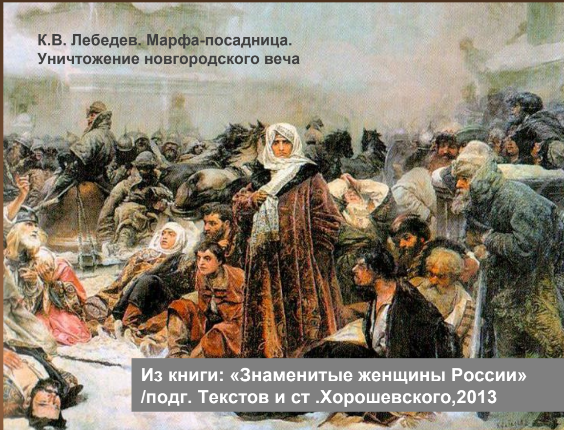
К.В. Лебедев. Марфа-посадница. Уничтожение новгородского вече

Из книги: «Знаменитые женщины России» /подг. Текстов и ст. Хорошевского, 2013