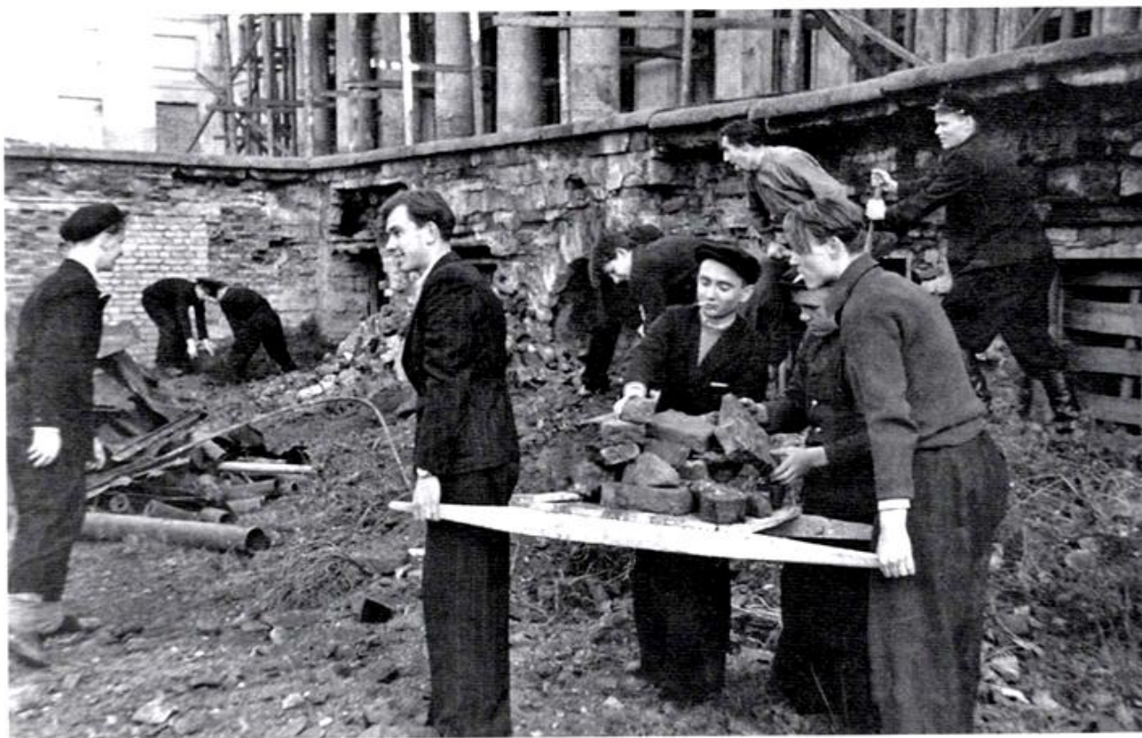
Студенты ЛИИЖТ на работах по восстановлению Дворца Юсуповых на Фонтанке. 1945 г.