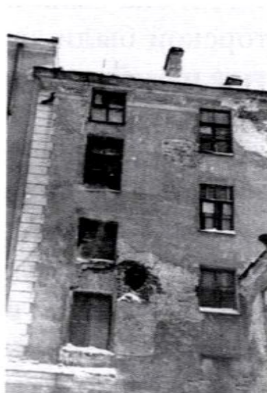
Жилой дом профессоров и преподавателей Института (ныне 11-й корпус, на фото слева) и 12-й (ныне 2-й) корпус со следами поражения вражескими артиллерийскими снарядами. Фото 1941–1944 гг.