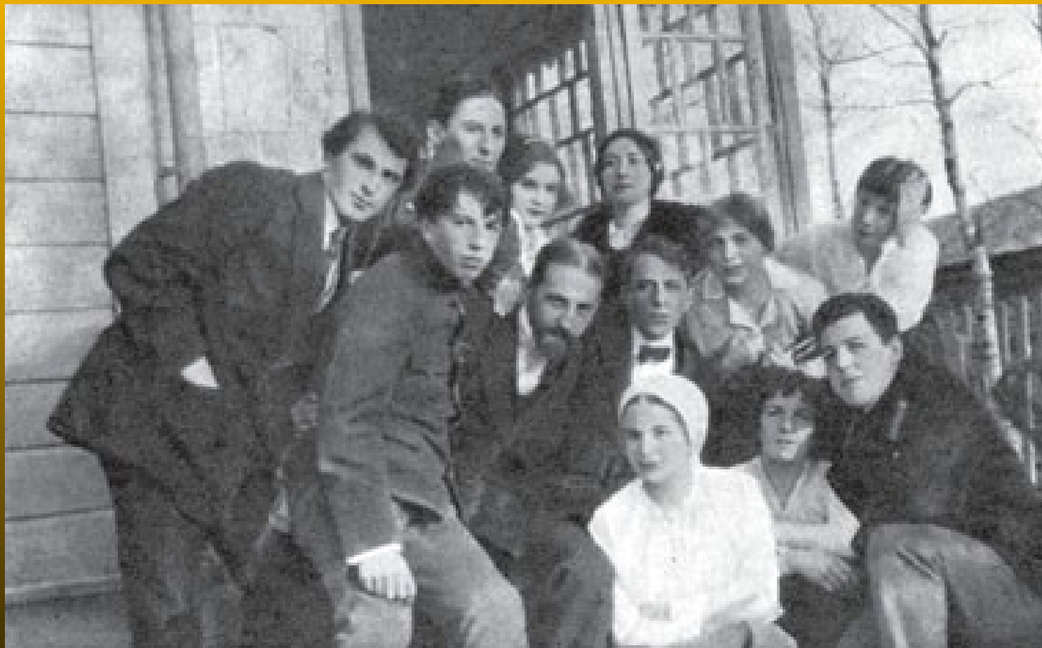
В. Э. Мейрехольд с группой сотрудников и учеников Студии на Бородинской. 1915 г