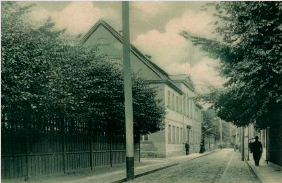
Либавское реальное училище