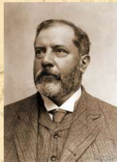
Леонтий Николаевич Бенуа (1856 – 1928)