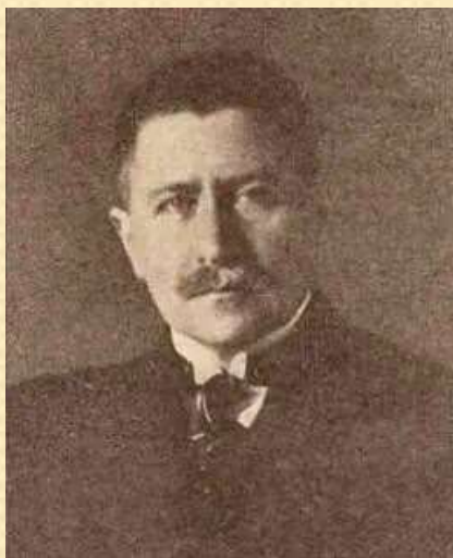
Мариан Перетяткович 1872 - 1916

Родился Мариан Перетяткович 23 августа 1872, в селе Усичи Луцкого уезда Волынской губернии, в семье польских помещиков. Окончил Ровенское реальное училище в 1890 году и поступил в военное училище. После окончания училища был произведен в корнеты 2-го драгунского генерала фельдмаршала князя Меншикова полка. Военную карьеру завершил в 1896 году в 1-м казачьем Уманском полку. В 1901 г. окончил Институт гражданских инженеров императора Николая I. В 1901—1906 гг. продолжил обучение в Высшем художественном училище при Императорской Академии художеств.