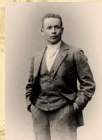
Готтлиб Элиэль Сааринен 1873-1950