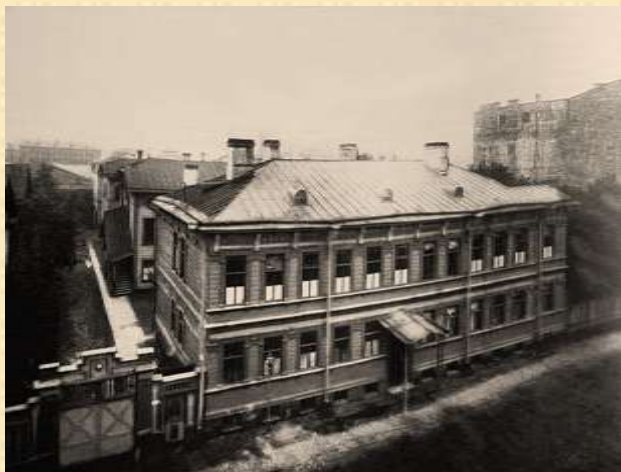
Главное здание приюта для мальчиков

Есть в биографии Мариана Перетятковича и не совсем обычная страница. Один свой проект он сделал безвозмездно — это здание до сих пор стоит на Кирилловской улице, 19. Сейчас в нем размещается Ленинградская областная научная библиотека, а первоначально (в 1912–1913 году) оно предназначалось для Приюта для мальчиков Римско-католического благотворительного общества. Еще его называли «Дом Кербедза», поскольку средства на строительство дал сын известного инженера Станислава Кербедза Михаил. На эти деньги М. Перетяткович возвел четырехэтажное здание в неоклассическом стиле. Приют был открыт 30 октября 1913 года. В доме разместились мастерские, школа, интернат, столовая и библиотека. В мастерских наряду с воспитанниками трудились также 50 наемных рабочих. В приюте воспитывалось около 150 мальчиков. Руководил приютом ксендз Антоний Малецкий. Преподавание в школе велось на русском, но здесь изучали также и польский язык, отмечали католические праздники.