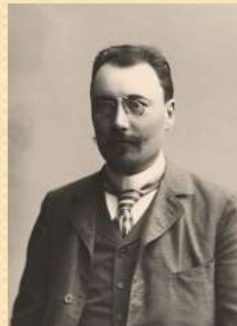
Ларс Элиел Сонк 1870 - 1956