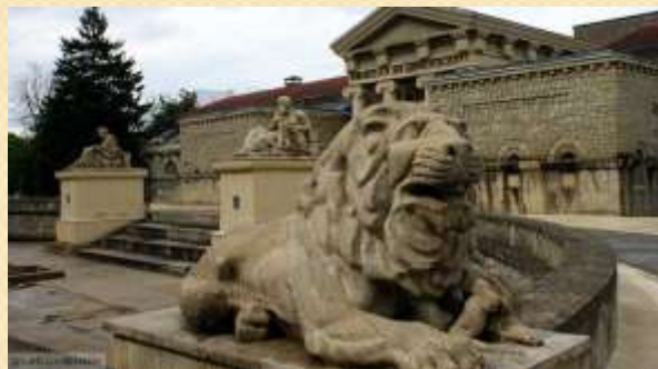
Грязелечебница в Ессентуках