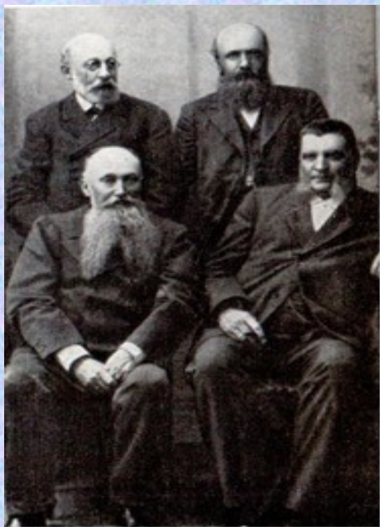
К.Ф.Рерих (сидит слева)