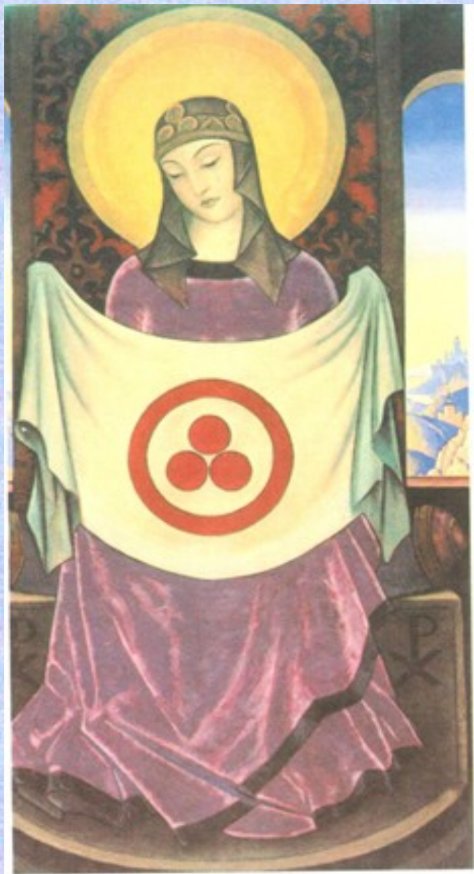
Н. К. Рерих. Madonna Oriflamma (Владычица Черноно-пламенная), 1932. Музей Рериха, Нью-Йорк.