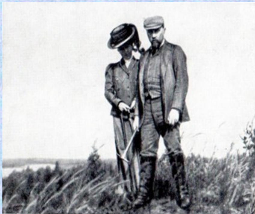
Н. К. Рерих и Е. И. Рерих. 1904 г.