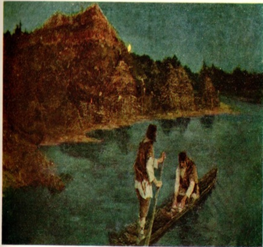
«Гонец. Восстал род на род» 1897 год

В Академии художеств Рерих занимается в мастерской профессора А.И. Куинджи.