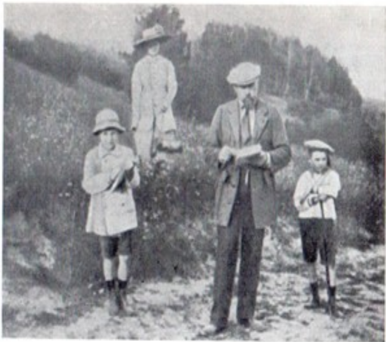
Н. К. Рерих и Е. И. Рерих с сыновьями.

«Нелегко описать жизнь, в ней было столько разнообразия...» Н.К. Рерих