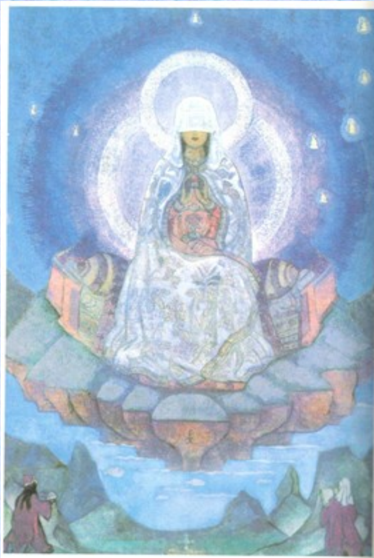
Н. К. Рерих. Матерь Мира, 1924. Музей Рериха, Нью-Йорк.