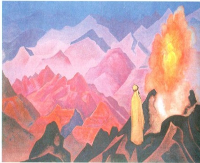
Н. К. Рерих. Пророк Мухаммед на горе Хира, 1925. Собрание Боллинга, США.

• Давней мечтой был Восток. Начиная с 1923 года и в течение пяти лет, Н.К. Рерих и Е.И. Рерих предпринимают большое путешествие по Индии и Центральной Азии, в Тибет, Китай, на Алтай, в Монголию.