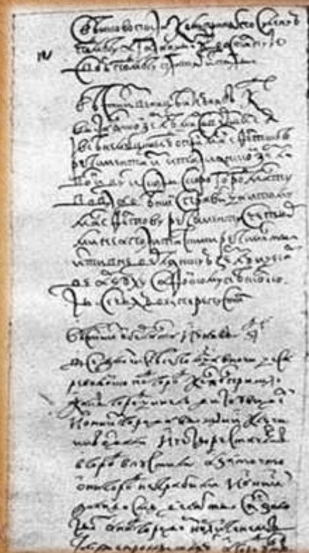
Вести-Куранты. Первый лист «вестей» за 1631 г. Источник: Вестник КемГУКИ. – 2012. – № 20. – с.83