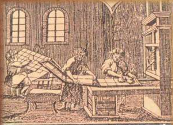
ТИПОГРАФИЯ ПЕТРОВСКИХЪ ВРЕМЕНЪ.

Источник: Чистяков А.С. История Петра Великого