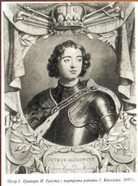
Петр I. Гравюра Н. Гуиста с портрета работы Г. Кнеллера. 1697 г.