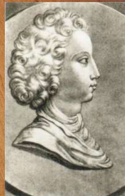
Царевич Алексей Петрович. Гравюра П. Шенка с оригинала С. Гузна. 1703 г.