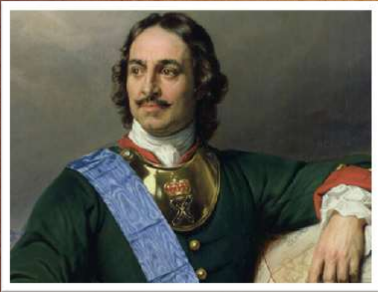
Худ. Поль Деларош. Портрет императора Всероссийского Петра Великого. 1838