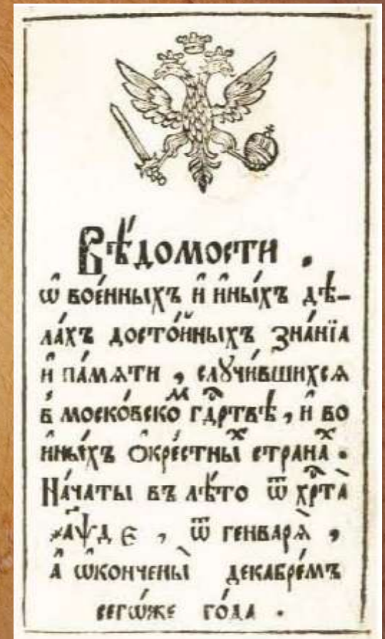
Заглавный лист Ведомостей 1704 г.