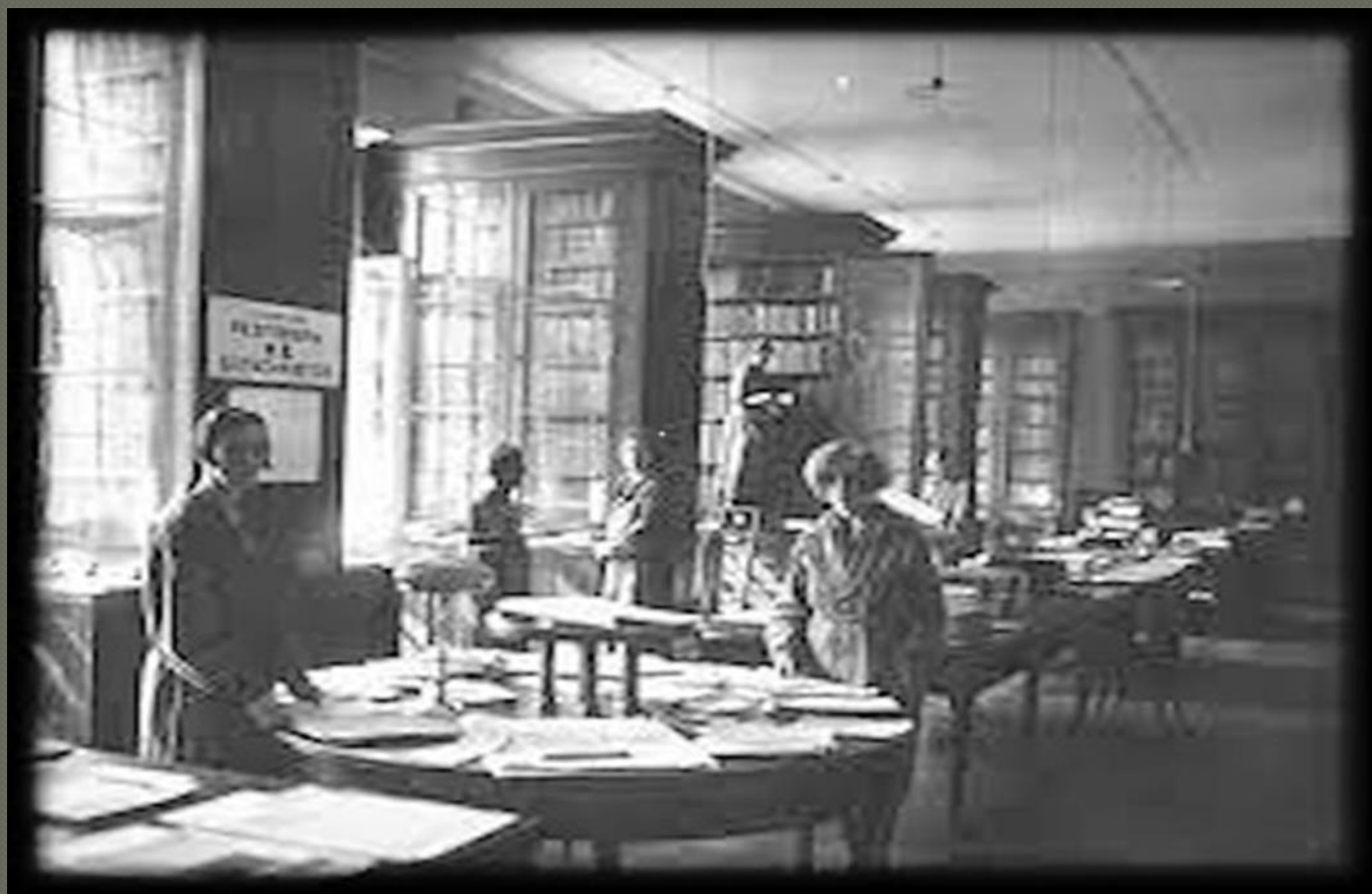
Профессорский читальный зал. 1944 год

Сотрудники вновь приступили к работе, неотъемлемыми составляющими которой было комплектование фонда библиотеки и популяризация литературы.