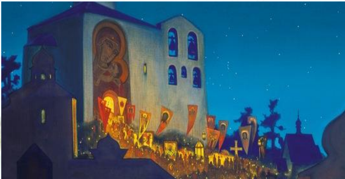
Русская пасха. Н. К. Рерих. 1924

Главное событие праздника Пасха - торжественное богослужение в храме. Пасхальная служба начинается в ночь с Великой субботы на Светлое Воскресенье.