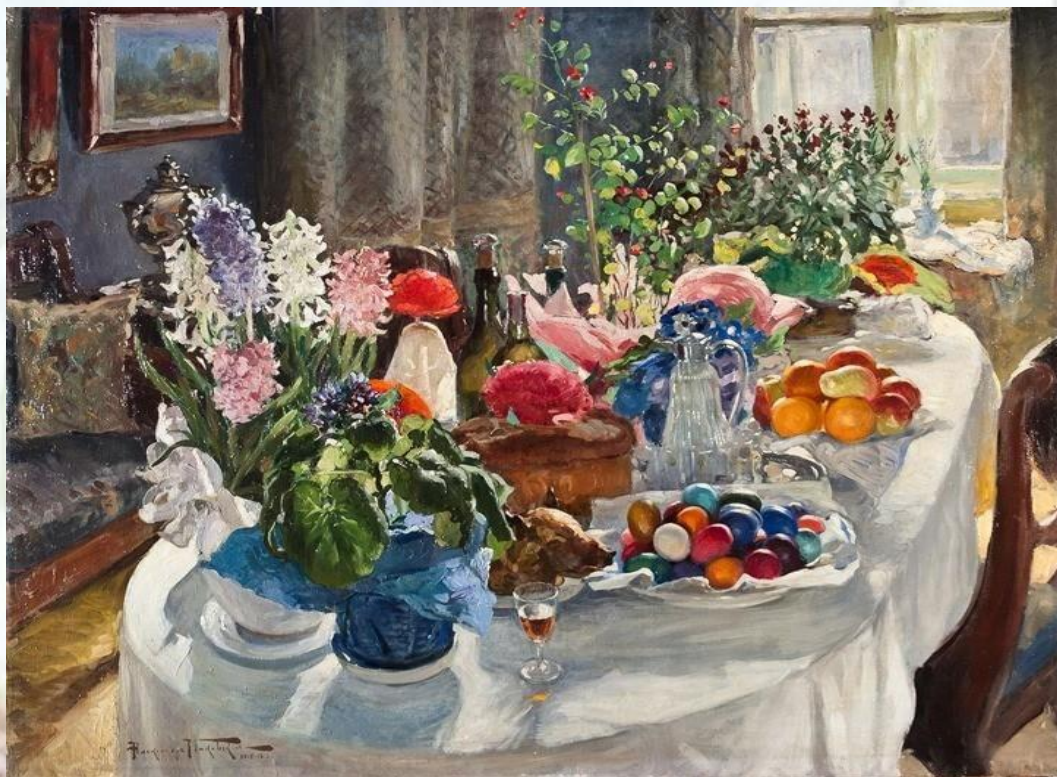
Пасхальный стол. А. В. Маковский. 1915-1916 годы

В XX веке традиция пасхальных открыток в России была разорвана революцией и антирелигиозной политикой, но сегодня она возвращается в культурное пространство.