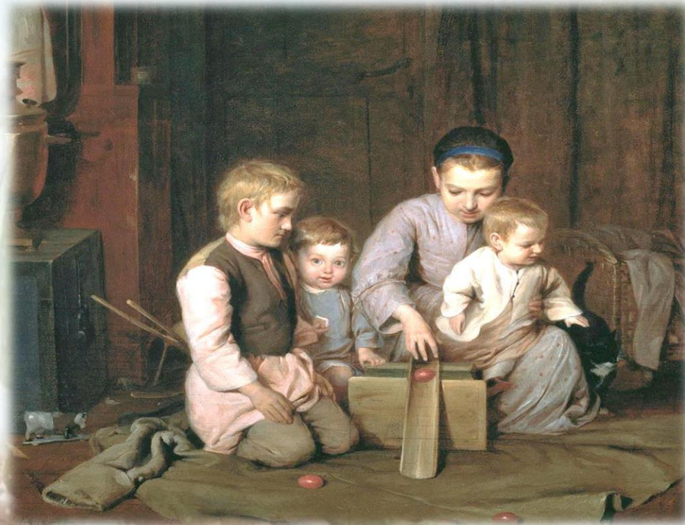
Дети, катающие пасхальные яйца. Н. А. Кошелев. 1855

В современном мире, где традиция открыток уступает место цифровым поздравлениям, возрождение интереса к дореволюционным образцам становится актом сохранения культурного кода нации.