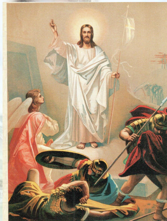
«...Так написано, и так надлежало пострадать Христу и воскреснуть из мертвых в третий день» (Лк. 24, 46). Воскресение Господа Иисуса Христа