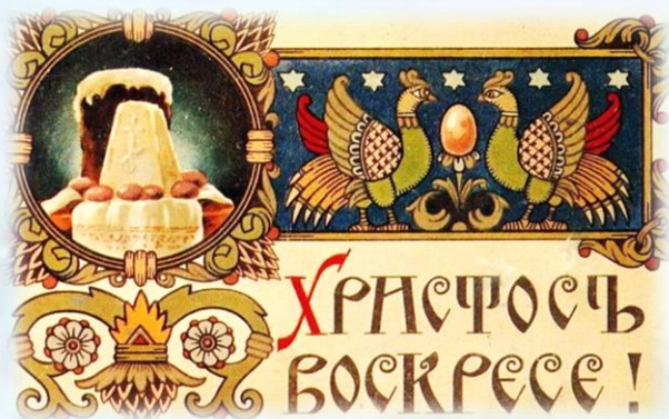
И. Я. Билибин