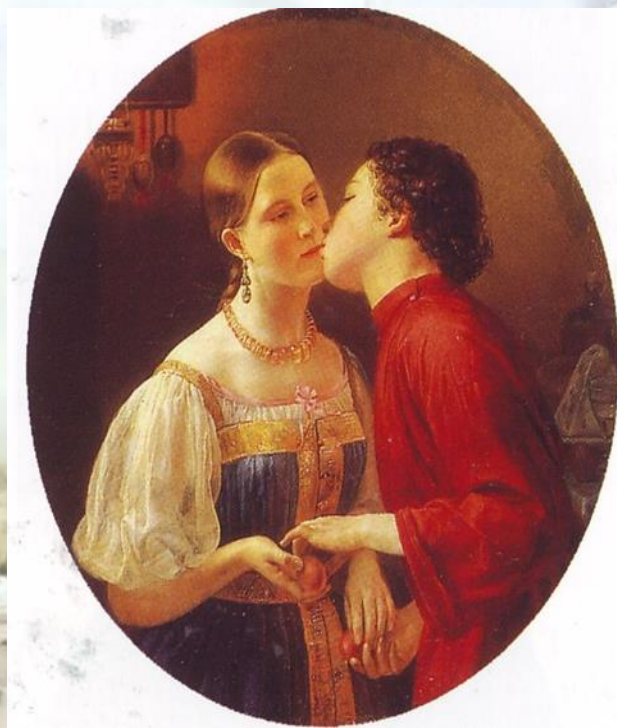
Христование. Ф. А. Горецкий, 1850

Пасхальная открытка - это не просто красивые изображения, а исторические документы, несущие в себе отпечаток времени. Коллекционеры, историки и искусствоведы изучают их как ценные исторические источники, позволяющие понять искусство и духовные традиции передающиеся из поколения в поколение.