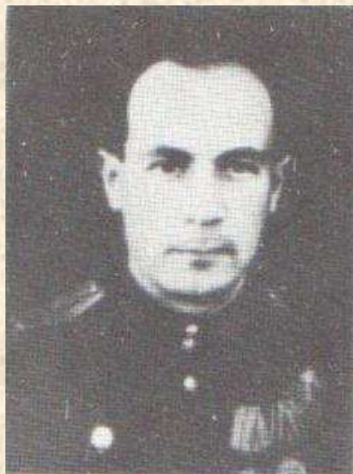
Астрахан Х. М.

Награждён орденами Отечественной войны II степени, Красной Звезды, медалями «За оборону Ленинграда», «За победу над Германией», юбилейными медалями.