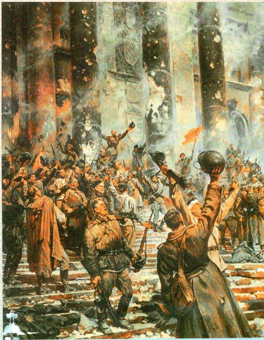
Победа (фрагмент). Худ. П. Кривоногов

Уважаемые ветераны Великой Отечественной войны!