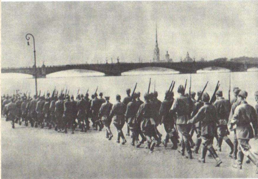
На защиту Ленинграда. 1941 г.

В годы Великой Отечественной войны тысячи преподавателей, аспирантов и студентов института вступили добровольцами в ряды Красной Армии, народного ополчения, героически сражались на подступах к Ленинграду и в партизанских отрядах в тылу врага.