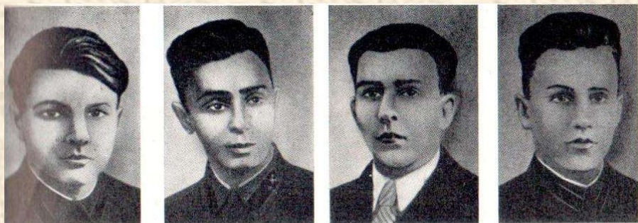
Студенты-комсомольцы, ушедшие добровольцами на фронт и погибшие в боях за Родину:

Как я люблю людей родной России! Они тверды. Их вспять не повернешь! Они своею кровью оросили те нивы, где сегодня всходит рожь. Их не согнули никакие беды. И славить вечно вся земля должна простых людей, которым за победы я б звезды перелил на ордена.