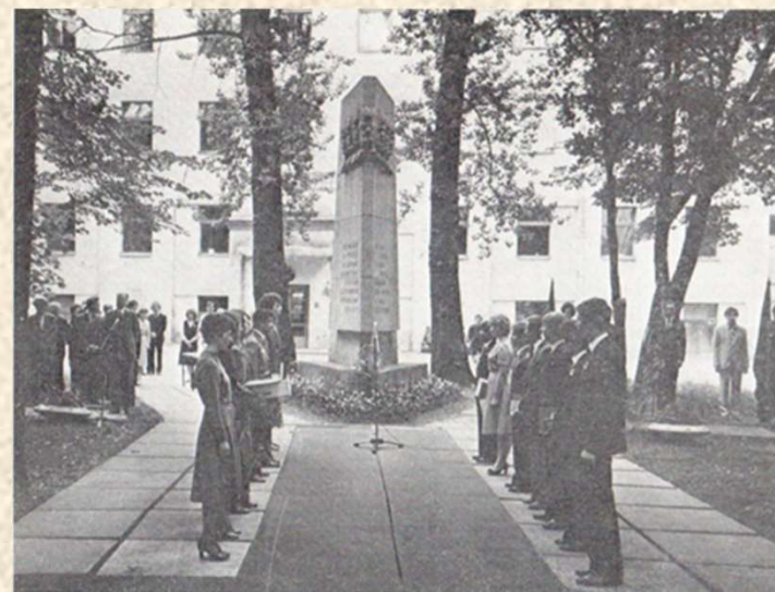
Посвящение в студенты.

В сквере нашего Университета, откуда в 1941 г. лиижтовцы уходили на фронт, на средства, собранные сотрудниками и студентами, в 1969 г. воздвигнут гранитный памятник погибшим в годы Великой Отечественной войны (автор проекта И. Г. Явейн).