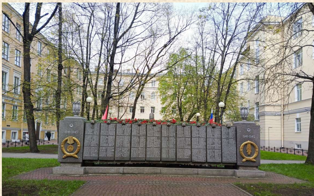
Фотографии из архива НТБ

Здесь приведены списки с именами 1 423 сотрудников и студентов института, отдавших жизнь за свободу нашей Родины в годы Великой Отечественной войны.